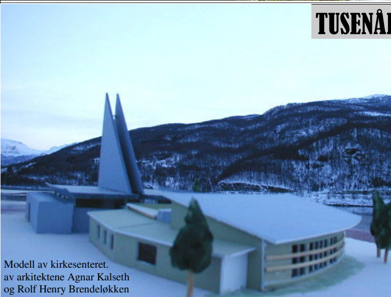
Modell av kirkesenteret, av arkitektene Agnar Kalseth og Rolf Henry Brendeløkken