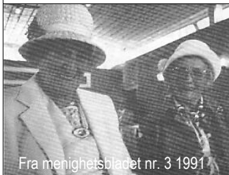
Fra menighetsbladet nr. 3 1991