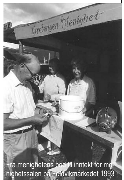
Fra menighetens bod til inntekt for menighetssalen på Foldvikmarkedet 1993

KIRKEPOSTEN PÅ NETT: http://www.lokalavisa.no . Klikk deretter på Gratangen og du kommer til avisa "Gratangsværingen". Øverst til venstre klikker du videre til spalten "Kirkeposten". Når du er kommet hit, ser du linken videre til gudstjenestelista og mer informasjon.