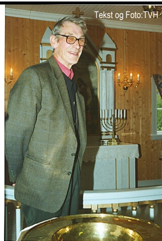
Tekst og Foto: TVH

Men heller ikke "Kalle" blir yngre med årene. Nå er han godt over 80 og ser gjerne at han får lære opp en som kan avlaste og senere overta etter ham.