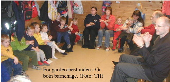
Fra garderobestunden i Gr. botn barnehage.

med lærerne, samtalte vi om KRL faget: Kristendoms-, religions- og livssynskunnskap. I vårt flerkulturelle og flerreligiøse samfunn har dette faget en rolle å spille i å skape dialog om religioner og verdier og også øke kunnskapen om kristendommen som vår kulturs grunnlag. Det er viktig at samar-